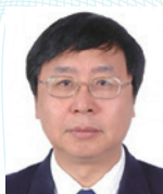
曲久辉 教授 中国科学院生态环境 研究中心 研究员 (中国)