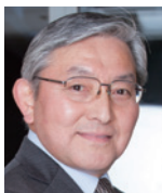
古米 弘明 教授 东京大学(水环境研究) 教授 (日本)